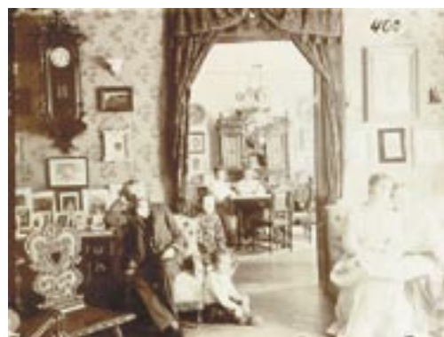
Vízmathyék szalonja és ebédlője 1900 körül