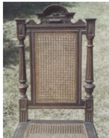
Ónémet ebédlőszék háttámlája

kép, melyek többsége először kerül publikálásra. A kiadvány forgatása nemcsak művészettörténészeknek, de régiségkereskedőknek és a mai faiparosoknak,