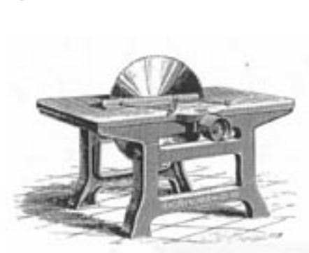
Bécsei cirkula a századfordulón

Hasonló magatartást nyugaton is lehetett érezni, de ott hamarabb észhez tértek és mára már mindkét stílusnak hatalmas népszerűsége és irodalma van. Nem így nálunk, ahol csak a hetvenes években nyílt meg az érdeklődés a szecesszió iránti