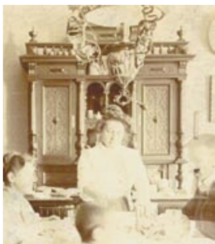
Nagytálaló a Vízmathy-ebédlőben

tárgyait szembesítem különböző mintalapokkal és leírásokkal, rátérek munkám másik lényeges pontjára: kik állították