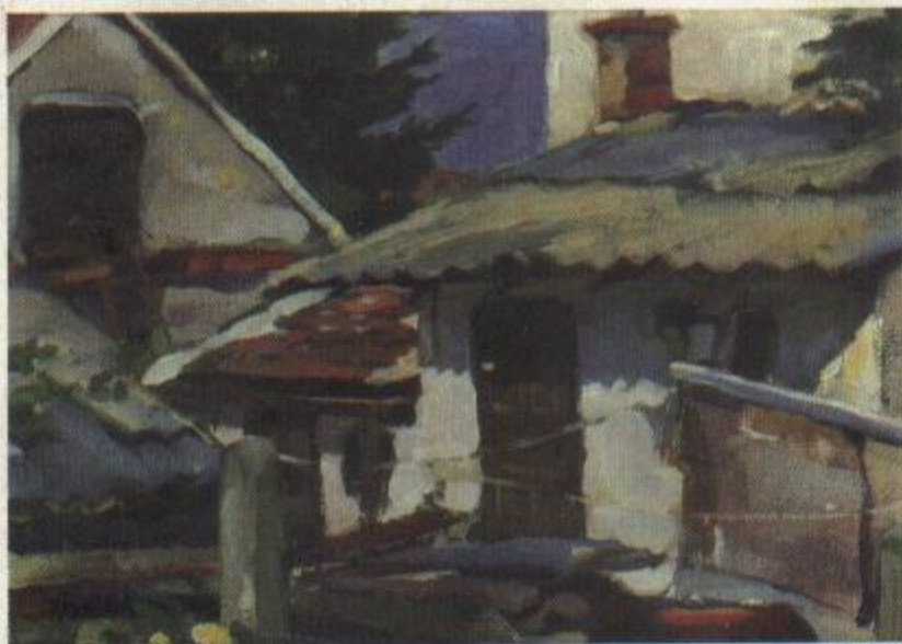
Mosokonyha 2000. (olaj)

Valójában csak az elmúlt hat évből próbálok majd valamit bemutatni ezen a kiállításon. Az utóbbi években talán valamivel színesebbé, helyenként expresszívebbé vált a stílusom, kevesebbet óvatoskodok. Az alapok azonban alig változtak: ma is a régi nagyok a mérce számomra, a humánus művészet. Az elidegene-